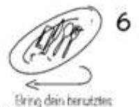
Bring dein benutztes Geschirr wieder zurück