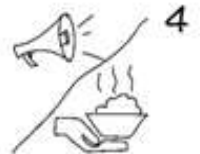
Je nach Betrieb bringen wir dir das Essen an den Tisch oder rufen deinen Namen aus